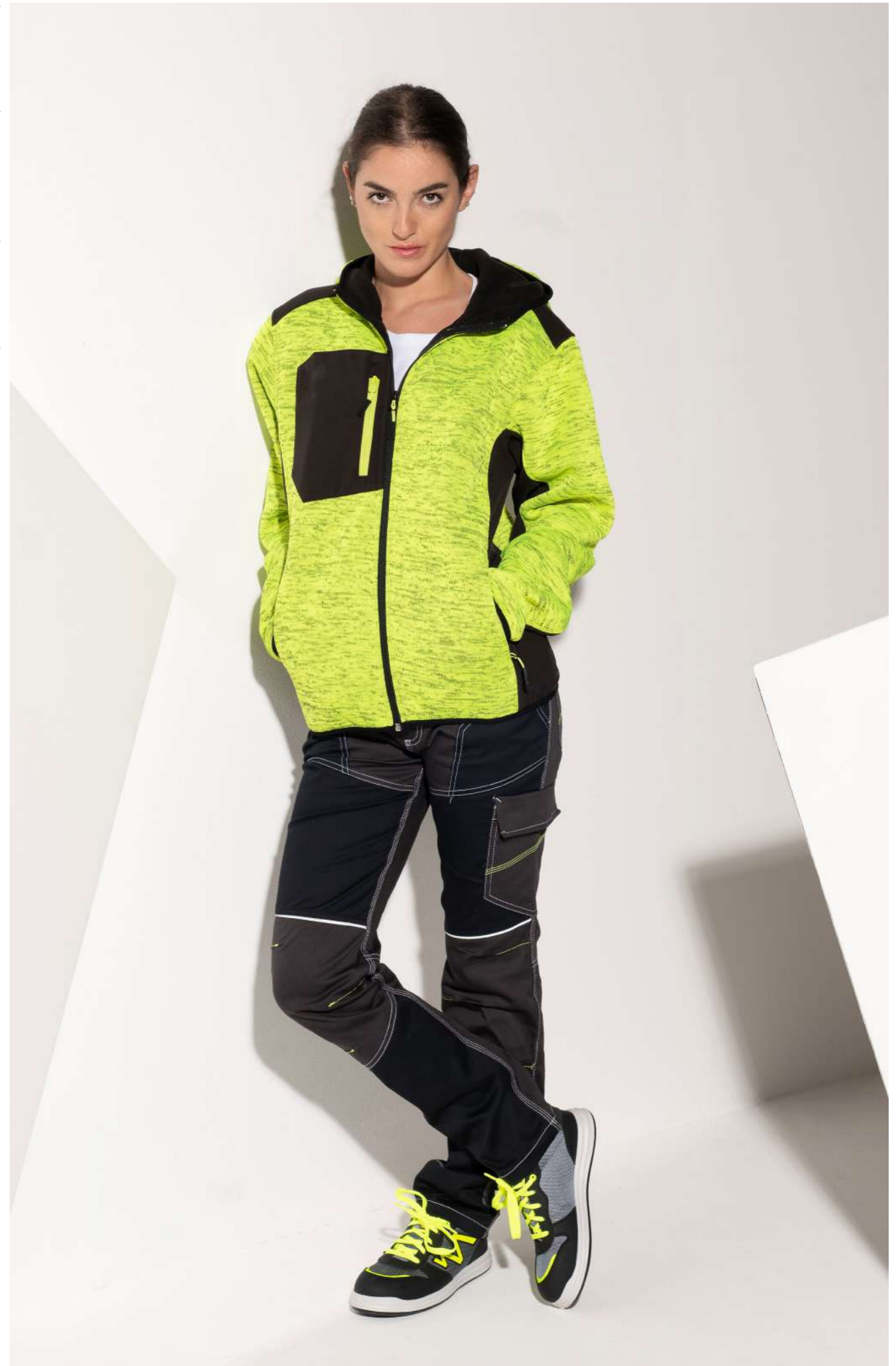
Giacca HONET (Cod. GGXIV 300) – Pantalone JUMP (Cod. JMP02 536)