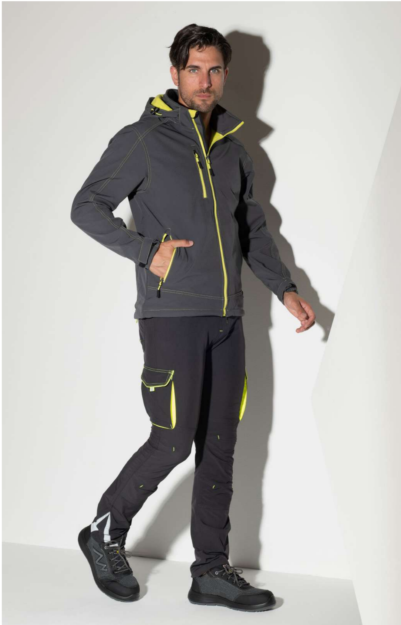
Softshell NORTON (Cod. GGXEV 417) – Pantalone RIDER (Cod. SPX2A 145)